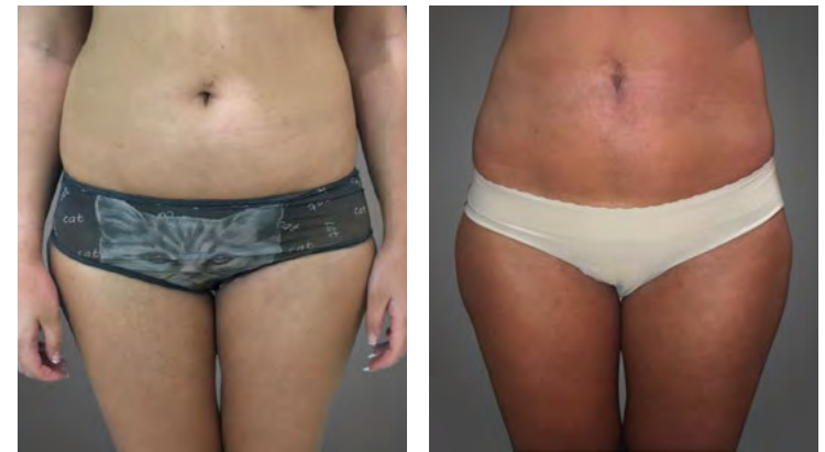
Masti u telu su se rastvorile nakon 12 tretmana sa Pluryal Mesoline BODYCONTOUR

Voditi zdrav životni stil koji se sastoji od zdrave i uravnotežene ishrane, plana vežbanja osnova je samopouzdanja. Kombinovanjem vašeg zdravog načina života sa našim Pluryal proizvodima dobićete najbolje rezultate!